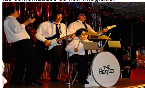
Fiesta Playback Dic 2012

maravilloso ver cómo el evento ha crecido y cómo las comunidades se han integrado.