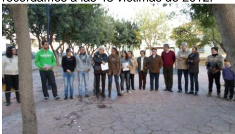
Asociación contra la violencia de la mujer

Apoyamos la Asociación Contra la Violencia de la Mujer, donde leemos un poema en público y recordamos a las 43 víctimas de 2012.