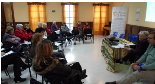
Asem. Gen. Feb 2013

vienen de, o tienen conexiones con los cuatro pueblos